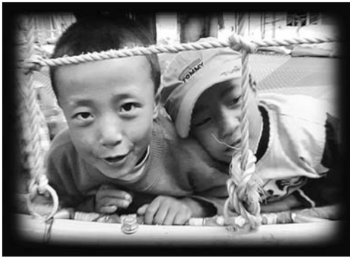
Manfred Neuwirth, Tibet Revisited , 2005