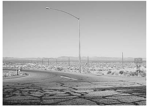
Dariusz Kowalski, Interstate , 2006